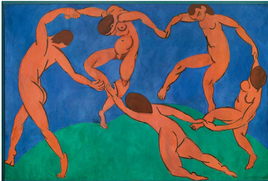
La Danse, Henri Matisse